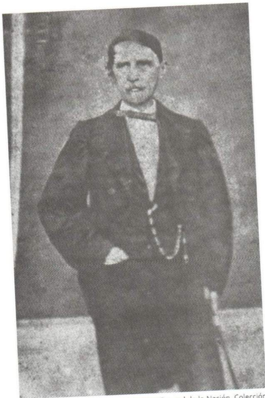
Juan Pablo Duarte y Díez (1873). Archivo General de la Nación, Colección José Gabriel García.