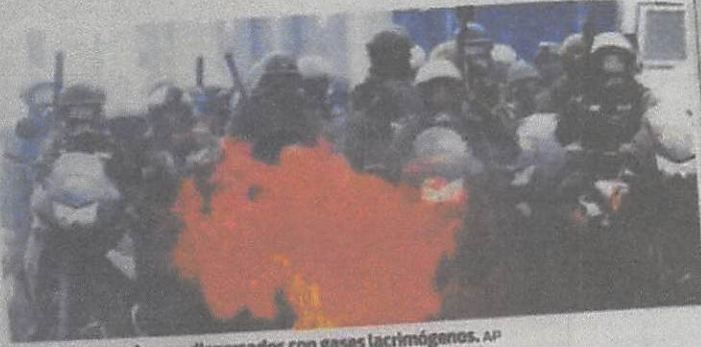
Manifestantes fueron dispersados con gases lacrimógenos.

CARACAS Los manifestantes no lograron su cometido de entregar un documento en rechazo a la Asamblea Constituyente convocada por el presidente Nicolás Maduro porque centenares de policías los dispersaron con gases lacrimógenos cuando intentaban marchar hacia el centro de Caracas.