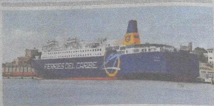
La nueva Nave Kydon inició sus servicios el día tres de mayo. KELVIN MOTA