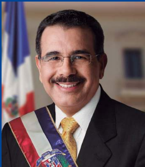
LIC. DANILO MEDINA SANCHEZ Excelentísimo Señor Presidente Constitucional de la República Dominicana Autoridad Suprema de las FFAA y PN