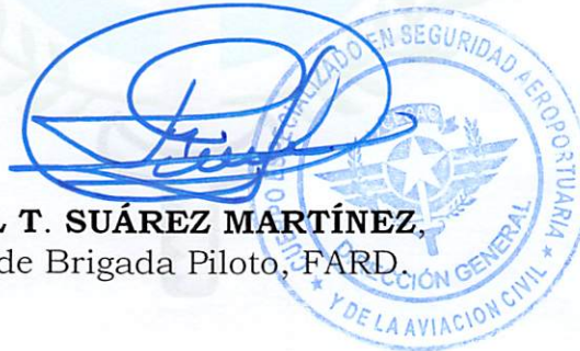
FLOREAL T. SUÁREZ MARTÍNEZ, General de Brigada Piloto, FARD.

1.- DEVUELTO cortésmente, con la aprobación de este Despacho.